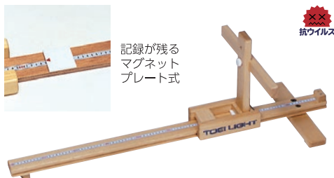
T-2233 長座体前屈測定器2 ¥15,730 (税別¥14,300)