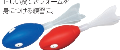
B-2710 PUロケットTL1(青) U-7028 PUロケットTL1(赤) ¥3,300 (税別¥3,000)