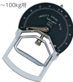
T-1781 握力計ST3 ¥12,100 (税別¥11,000)