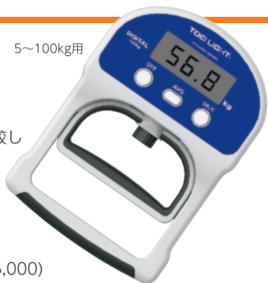
T-1854 デジタル握力計TL2 ¥27,500 (税別¥25,000)