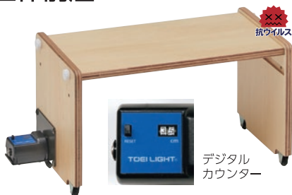
T-1817 長座体前屈測定器5 ¥34,870 (税別¥31,700)