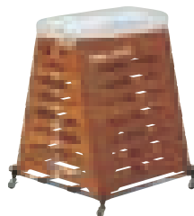
T-1312 8段(小)1台積載使用例

●幅96×長さ105×高さ11.5cm●4kg●スチール入り非塩ビ樹脂コートパイプ(直径28mm)●キャスター5cm(2ケストッパー付)●小型8段~中型8段まで運搬可能