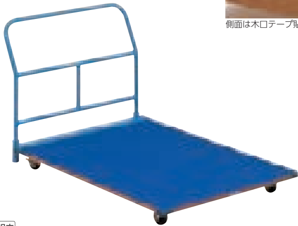
側面は木口テープ貼り

●幅120×長さ180×取手高さ95cm●72.5kg●主材:スチール●キャスター15cm=前輪:固定式、後輪:自在式(ストッパー付)●積載荷重:600kg●前輪側コーナー保護ゴム付