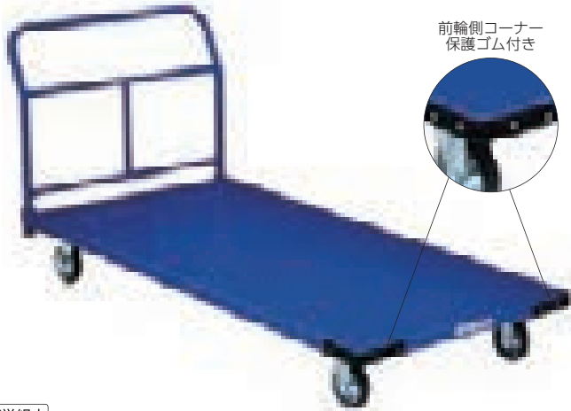
前輪側コーナー保護ゴム付き