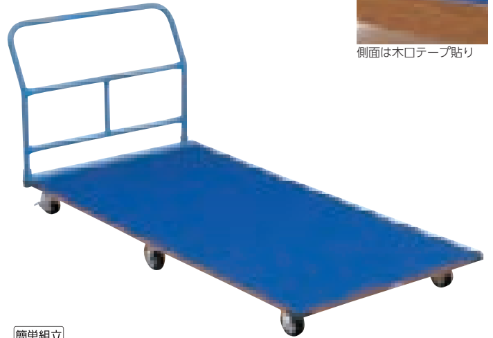
側面は木口テープ貼り

簡単組立 T-1695 マットトラック90×120 ￥86,020(税別￥78,200) 11