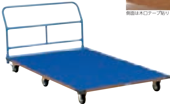
側面は木口テープ貼り

●幅90×長さ180×取手高さ78cm●33kg●主材:ラワンランバーコア板24mm●キャスター10cm=前輪:固定式、中輪:自在式、後輪:自在式(ストッパー付)●積載荷重:300kg●表面カーペット張●コーナー保護ゴム付