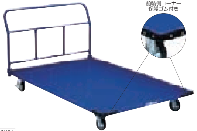
前輪側コーナー保護ゴム付き

簡単組立 T-1689 器具運搬車90×180 ￥127,820(税別￥116,200) 14